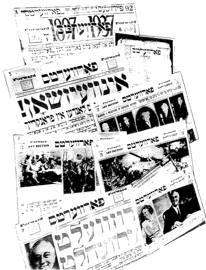
מבחר משערי הפארוערטס בעריכתו של קאהאן – בארבעים שנותיו הראשונות (1897–1937)