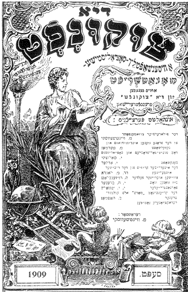
תחנה מוקדמת בדרכו העתונאית של קאהאן - הצוקונפט, ירחון חברתי-פוליטי שהופיע בניו יורק