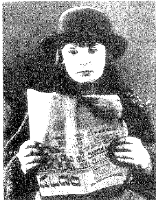
שתי פנים לקוראי הפארוערטס בשנות ה-10 וה-20 של המאה הקודמת: הילד ג'קי קוגן, שכיכב לצד צ'רלי צ'פלין מחזיק בידו עותק של העתון; משמאל אדם מבוגר קורא את העתון על ספסל בגן ציבורי