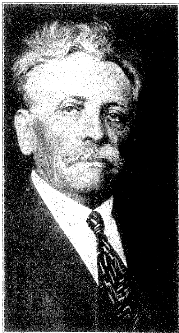
קאהאן המבוגר. הוא ערך את העתון עשרות שנים, עד יום מותו ב-1951, בגיל 91

השקפה פוליטית מורכבת ושיטתית אצלו, המבוססת על הסוציאליזם או לכל הפחות מתייחסת אליו. באותה מידה ניתן גם לטעון שהעובדה שבארצות הברית - למרות היותה "עולם חדש" - בכל זאת התקיימה מציאות מורכבת שחייבה התייחסות בהתאם, עשויה היתה דווקא לתרום להשתרשותן של השקפות שיובאו לאמריקה מ"העולם הישן". כך אמנם קרה בלא מעט מקרים בהם אימצה אמריקה ה"חדשה" את ניסיונם הפרוגרסיבי של אירופאים "ישנים". כך או אחרת, קאהאן לא נימנה עם התורמים לפרוגרסיביות באמריקה.